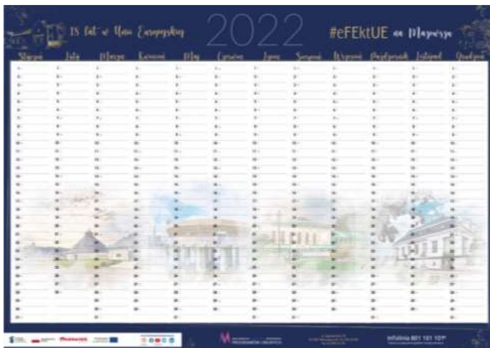
Przykład graficzny nie stanowi obligatoryjnego wzoru