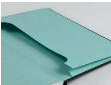
Papierowa przestrzenna koperta

Przykłady graficzne nie stanowią obligatoryjnego wzoru