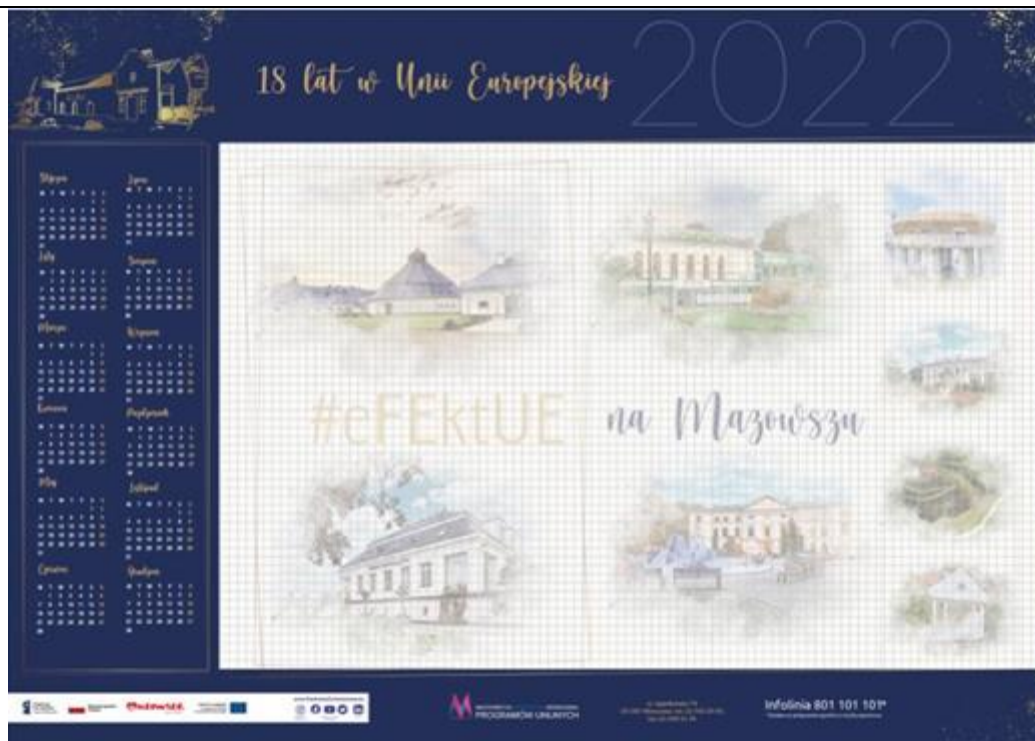
Przykład graficzny nie stanowi obligatoryjnego wzoru